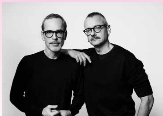
Viktor Horsting et Rolf Snoeren