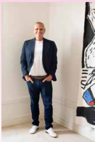
Jean-Charles de Castelbajac