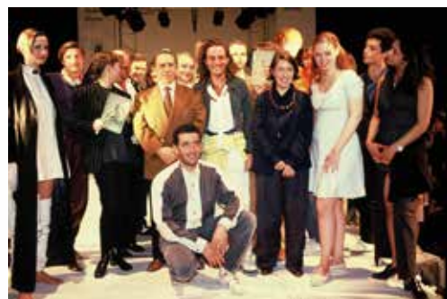
Cérémonie de remise des prix par le jury présidé par John Galliano, 1991