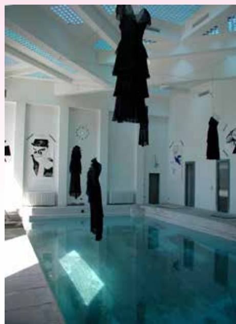
Exposition de Karl Lagerfeld, Président du jury, dans la piscine de la villa Noailles, 2002