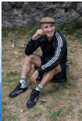
Tim Walker ©STELLA GREEN