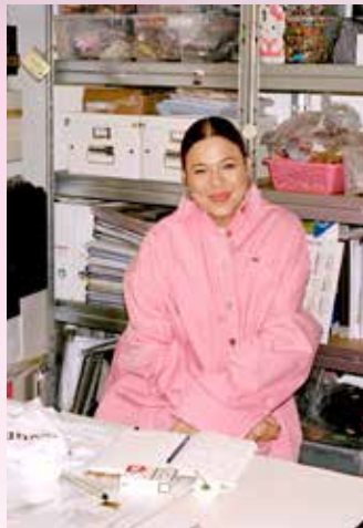
Stephanie D'Heygere © Spela Kasa