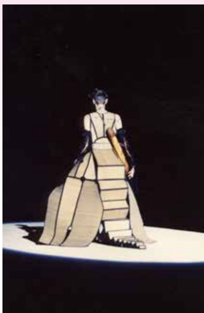
Collection de Billie Mertens, 1992