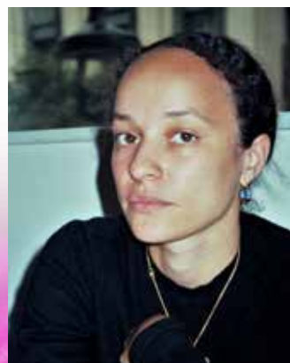
Grace Wales Bonner