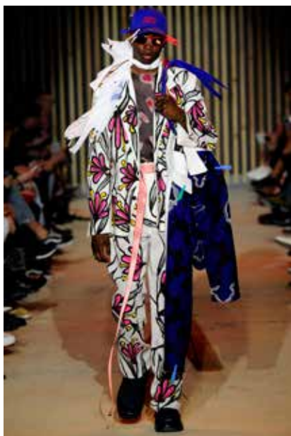
BOTTER, lauréats 2018