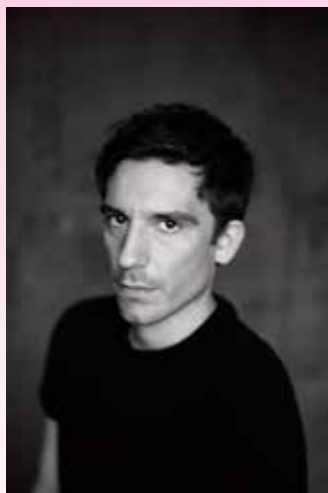
Julien Dossena