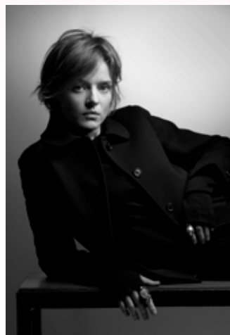
Priscilla Royer © Karl Lagerfeld