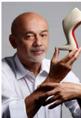
Christian Louboutin