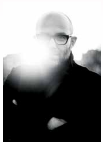
Sølve Sundsbø © Anne Vesaas