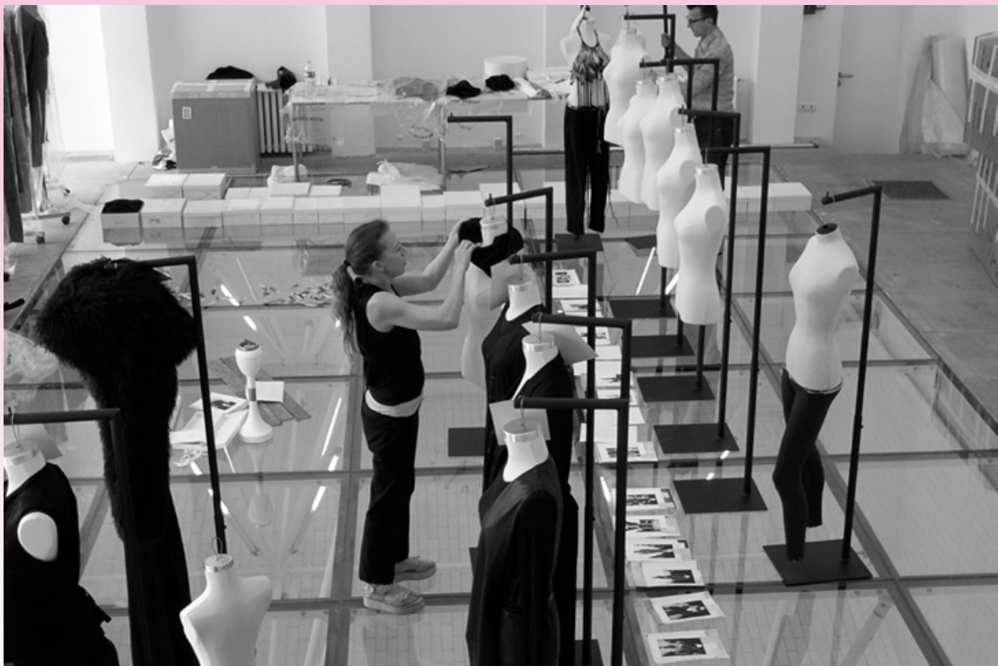
Ann Demeulemeester, Présidente du jury, monte son exposition dans la piscine de la villa Noailles, 2006