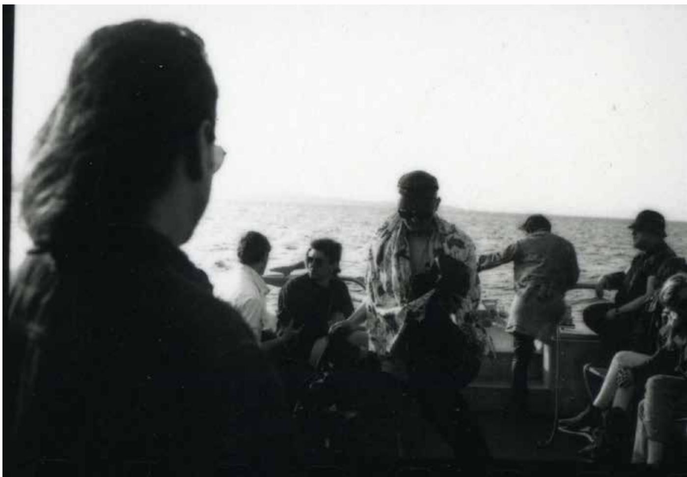
Le jury présidé par Helmut Lang sur le bateau pour Porquerolles, 1992