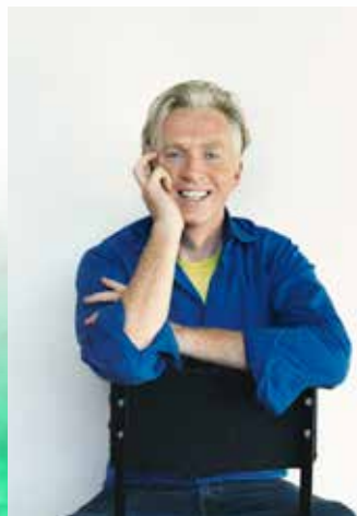
Philip Treacy