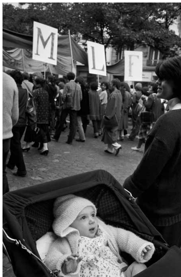
Paris, 6 octobre 1979. Lors d'une marche organisée par le MLF, 50 000 femmes manifestent pour la prolongation de la loi Veil, votée en 1974 pour une période d'essai de cinq ans.

« Pour nous éviter de vieillir idiots, Martine Franck a eu l'intrépidité d'aller voir sur place. Tout d'abord elle a évité, et c'est une épreuve d'élégance, le reportage sportif sur ce slalom entre les fossés du radotage et le gouffre du gâtisme, agrémenté d'effets très payants de visages burinés et autres ravages du temps. À la place de ces estampes généreusement charbonnées, Martine Franck nous donne à voir un univers où se prolongent tout simplement nos caractères et nos manies.»