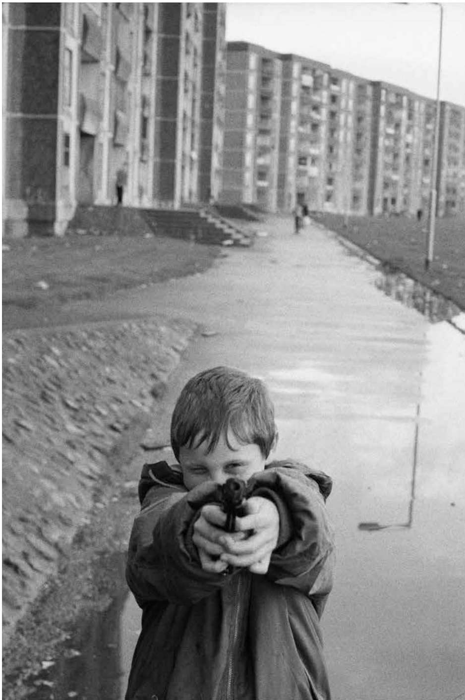
Ballymun, quartier nord de Dublin, Irlande, 1993.