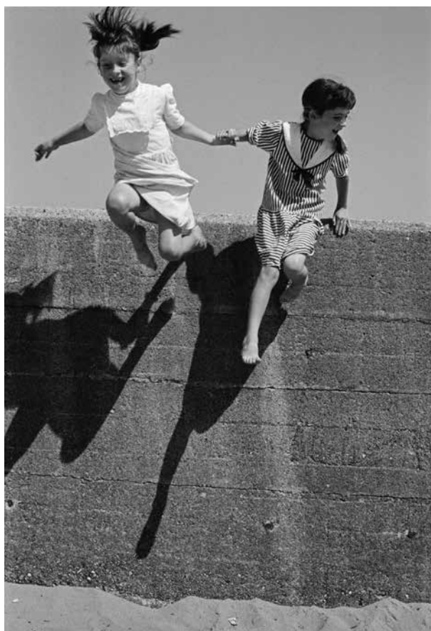
Île de Toraigh, Irlande, 1995.

Pour la première fois, la collection 100 photos pour la liberté de la presse met à l'honneur Martine Franck, photographe belge et cosmopolite. Épouse et égale d'Henri Cartier-Bresson, amie d'Ariane Mnouchkine, membre de Magnum Photos, elle a su imposer son regard, sa douceur et son talent, visibles dans ce numéro engagé et lumineux.