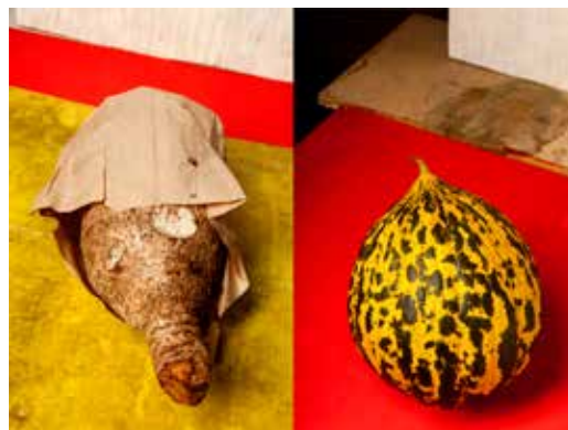
LORENZO VITTURI Italie | Royaume-Uni

Le Grand Prix du Jury Photographie est attribué à Lorenzo Vitturi.