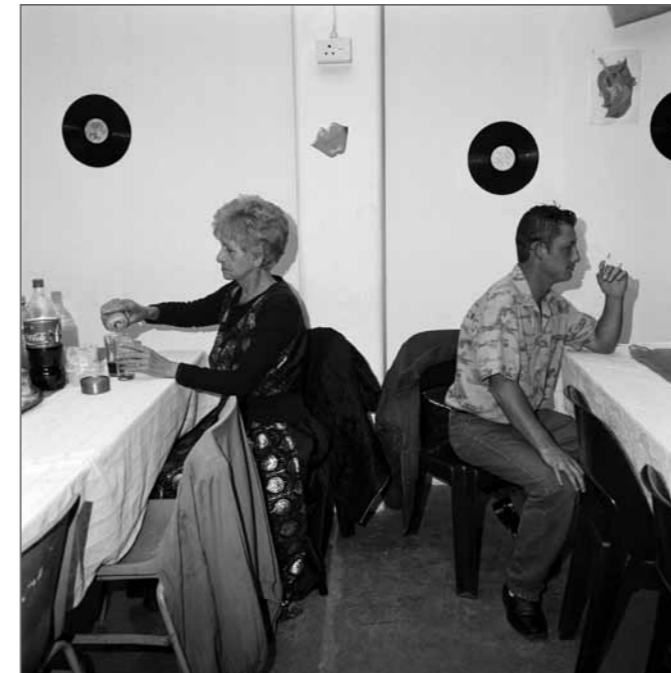
Atlantic Disco, Voortrekker Road, Brakpan, South Africa, 2009. For the series of images called Brakpan.