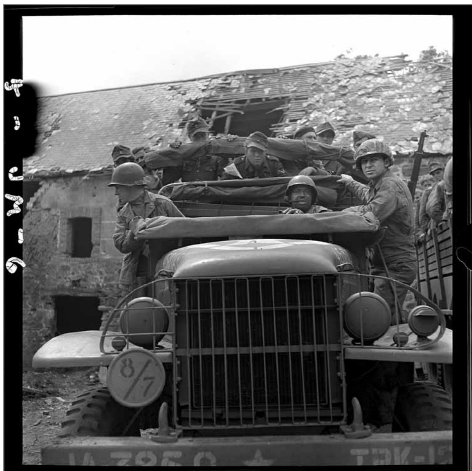
Des soldats allemands faits prisonniers après la bataille près d'Isigny, Normandie, juillet 1944.

La douzaine de pellicules noir et blanc 120 mm ramenées de ces quatre semaines de l'été 1944 étaient restées dans un tiroir. À l'approche de ses 97 ans et du 70 e anniversaire du 6 juin (D-Day), il a revisité ce reportage oublié, dont seulement une ou deux images avaient été publiées.