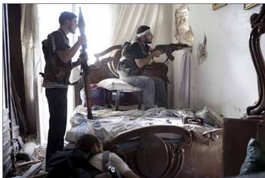
Ligne de front, quartier d'Arkoub, 19 octobre 2012. Des combattants de l'ASL surveillent une position sous contrôle de l'armée syrienne.