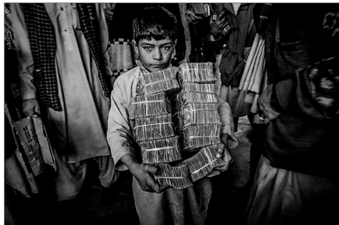
Jeune garçon apportant de l'argent afghan à la bourse de change de Herat, en Afghanistan. © Majid Saeedi / Reportage by Getty Images

Majid Saeedi / Reportage by Getty Images