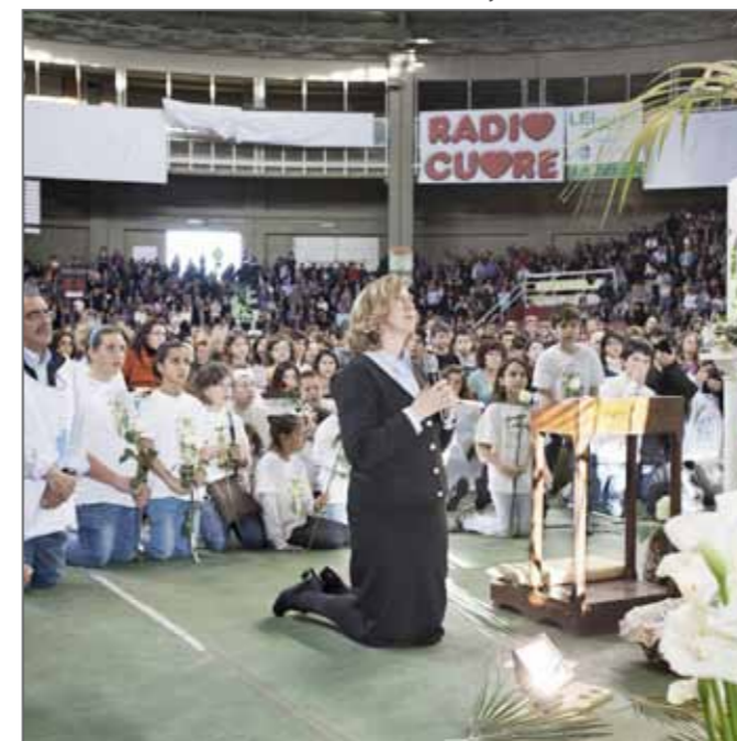
Italian elections