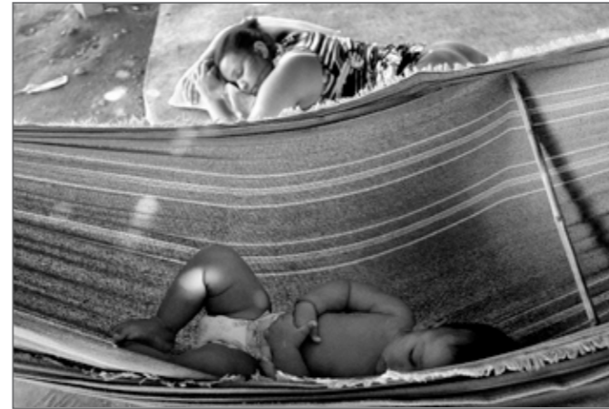
Maracanã Village © Dario de Dominicis