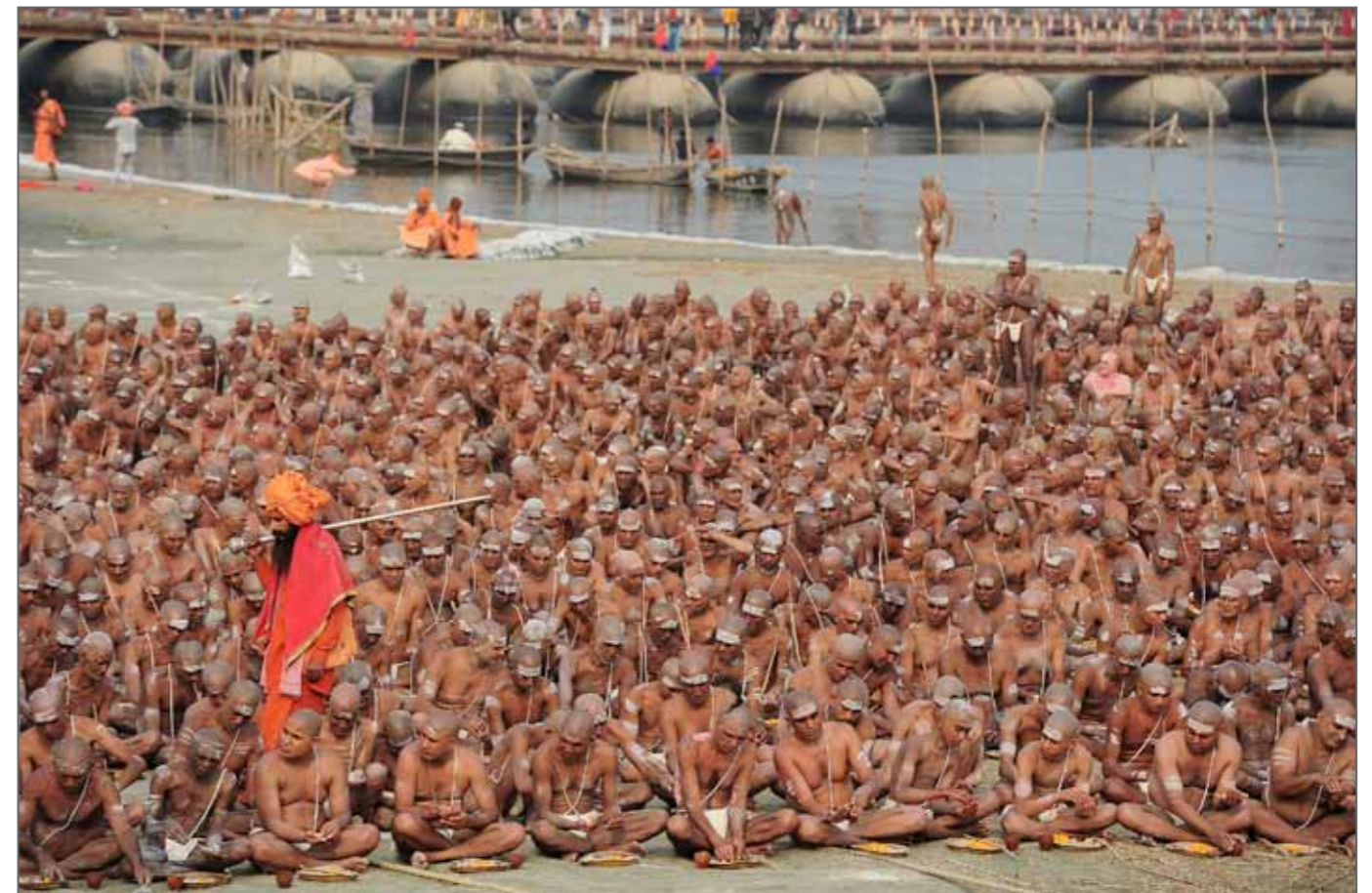
Des naga sadhus récemment initiés se préparent à accomplir des rituels sur les rives du Gange pendant la Maha Kumbh Mela : il s'agit du rituel d'initiation « diksha », accompli par un gourou. Allahabad, Inde, 6 février 2013.