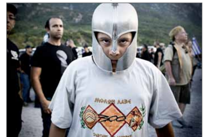
Aube Dorée