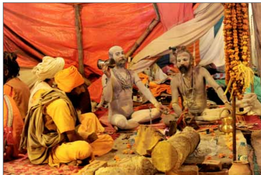
Des naga sadhus de l'akhara Juna sous leur tente, sur les rives du Sangam, au confluent du Gange, de la Yamuna, et de la mythique Sarasvati. Des millions de pèlerins hindous se rendent à la Kumbh Mela, l'un des plus grands rassemblements religieux au monde qui a lieu tous les 12 ans et dure 55 jours. Allahabad, Inde, 14 février 2013.