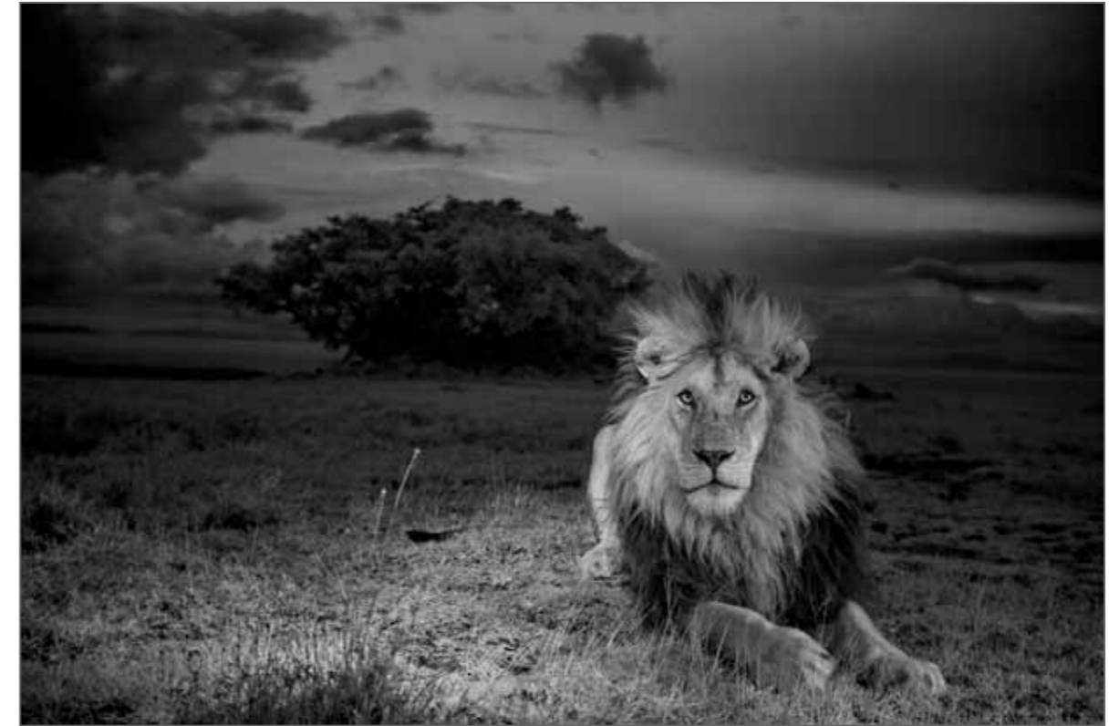
Parc national du Serengeti, Tanzanie, 2012.

Si j'ai passé une bonne partie de mon temps dans le Parc national du Serengeti à étudier les lionnes de la horde Vumbi , notamment leur façon d'élever les lionceaux malgré les difficultés de la vie dans les plaines, entre abondance et pénurie, le reportage actuel s'intéresse surtout à ce lion à la crinière noire, que les chercheurs ont prénommé C boy . Photo prise à l'aide d'infrarouges invisibles. Extrait d'un article sur les lions du Serengeti qui sera publié dans le numéro d'août 2013 du magazine National Geographic .