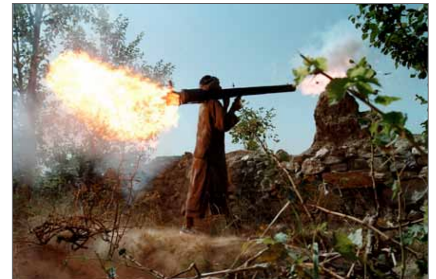
Afghanistan : Karizak, 10 septembre 1999. Un moudjahidin, combattant aux côtés d'Ahmad Chah Massoud, tire une roquette en direction des positions talibanes à Karizak, village de première ligne à environ 100 km au nord de Kaboul. Les forces de Massoud contrôlaient 10% du territoire et se battaient contre les intégristes talibanes.