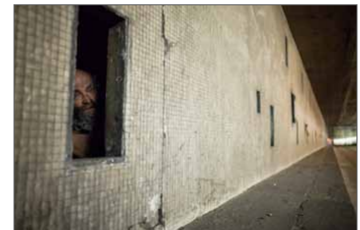
Les autres