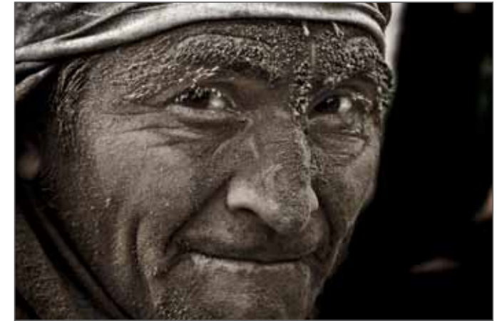
The Fallout of the Guano fever