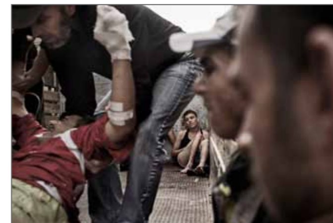
This is one of the images that won the Robert Capa Gold Medal 2013.