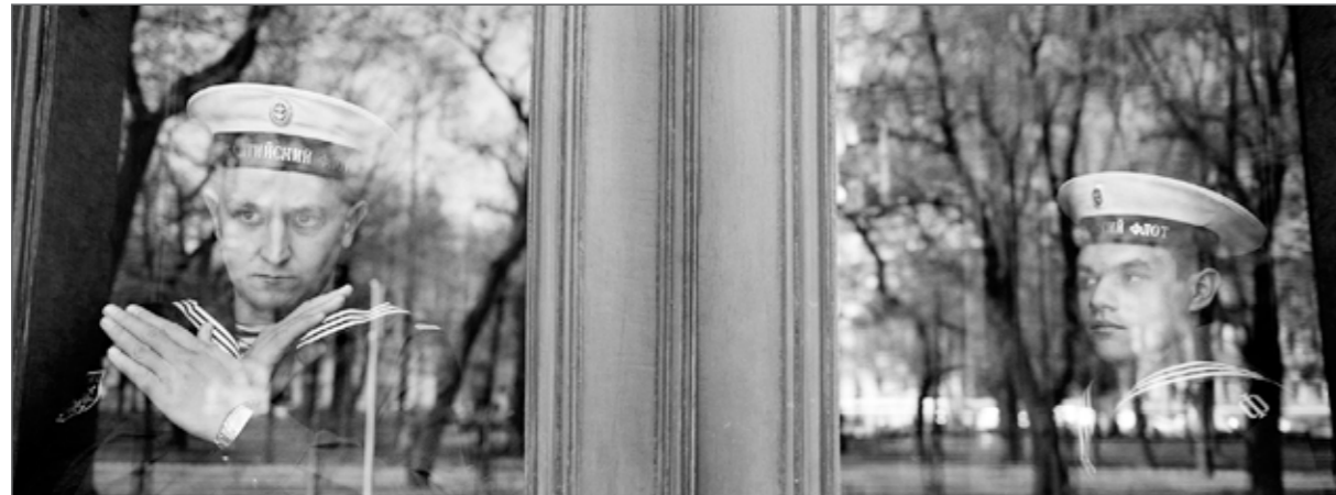
Is Corruption in Russia's DNA?