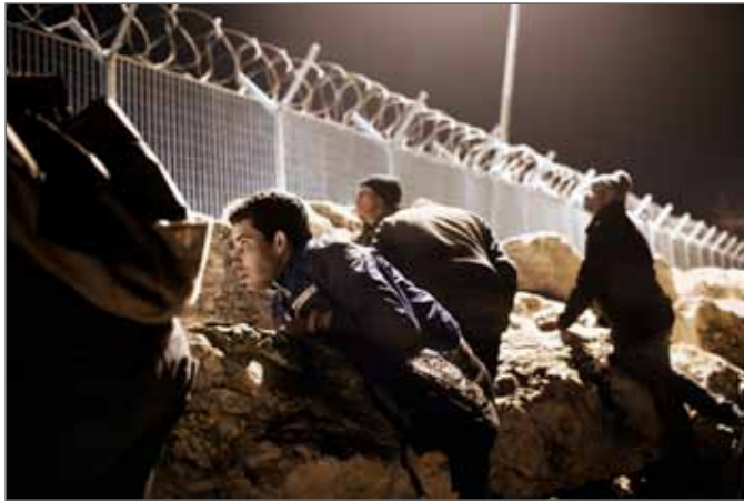
Youth Denied: Young Migrants in Greece