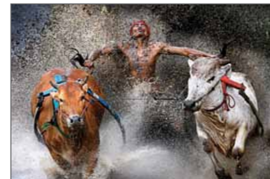
1 er Prix Sports en action - Photos isolées Sumatra occidentale, Indonésie, 12 février 2012