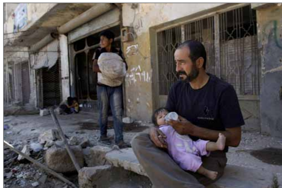
Père et fille devant leur maison en partie détruite, à Azaz, près d'Alep, Syrie, 28 août 2012.