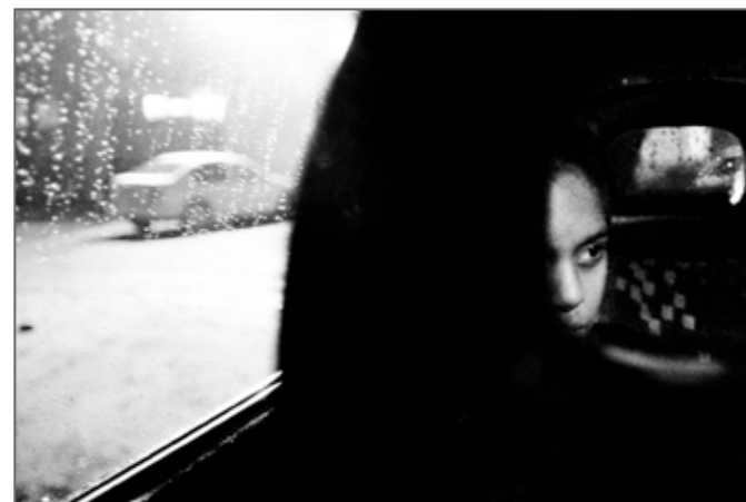
My Piece of Sky © Mariella Furrer Cette photo est présentée dans le livre My Piece of Sky de Mariella Furrer.