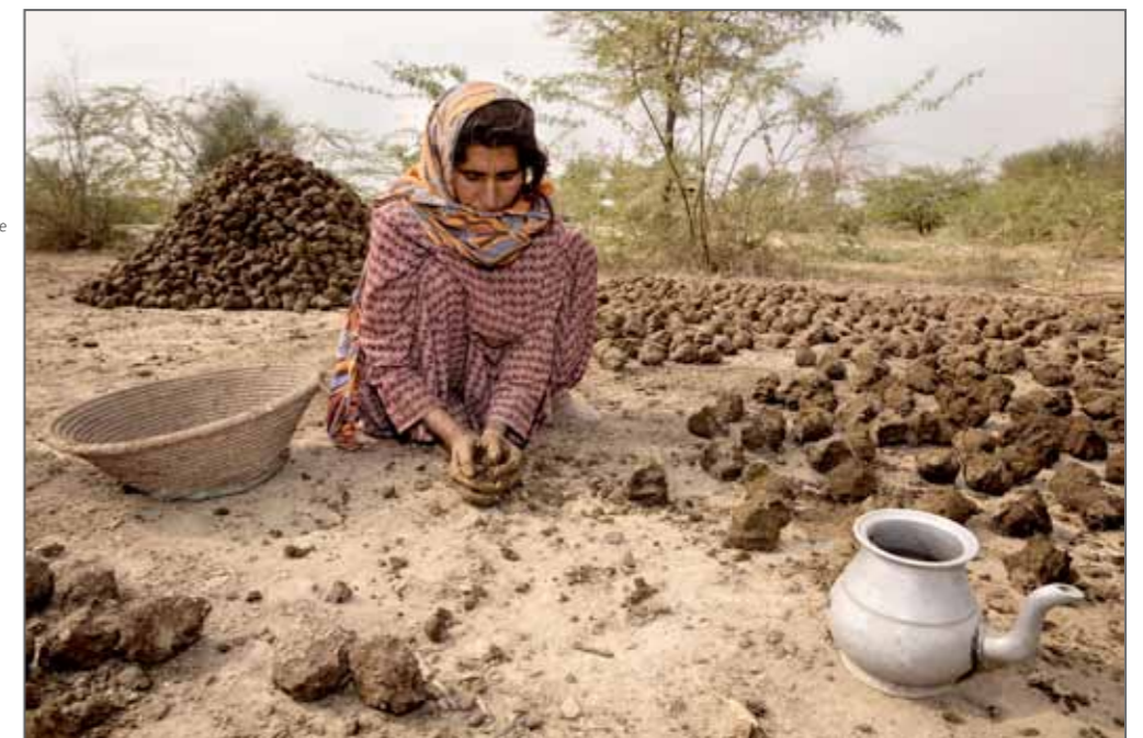
Une femme faisant sécher du fumier de vache. Il s'agit du combustible le plus utilisé par les familles pauvres pour se chauffer et cuisiner. Village, Khyber Pakhtunkhwa, Pakistan, 2013.