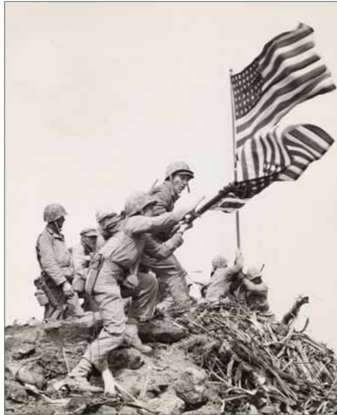
© Bob Campbell, USMC, American, 1910–1968 Flag Raising at Iwo Jima—Installing Large Flag on Mt. Suribachi February 23, 1945 Gelatin silver print The Museum of Fine Arts, Houston, gift of Will Michels in honor and in memory of Peter C. Marzio, Director of the Museum of Fine Arts, Houston, 1982–2010 Cette photo est présentée dans le livre War/Photography: Images of Armed Conflict and Its Aftermath d'Anne Wilkes Tucker.