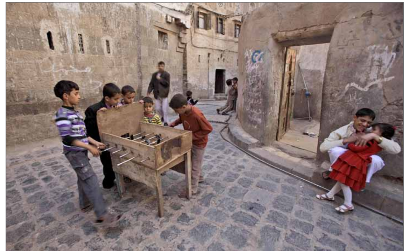
Partie de babyfoot dans une ruelle de la vieille ville de Sanaa. Les enfants ont confectionné eux-mêmes la table. Yémen, 26 novembre 2010.