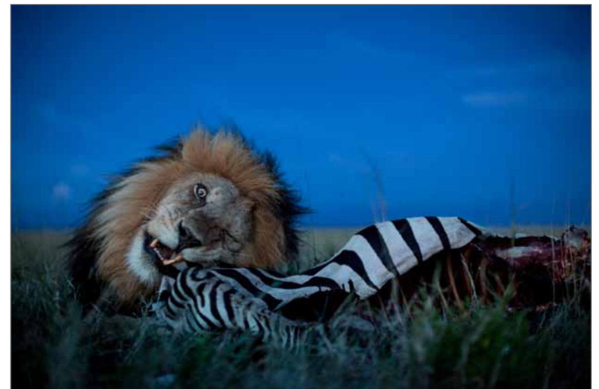
Photo prise à l'aide d'un robot tank. Extrait d'un article sur les lions du Serengeti qui sera publié dans le numéro d'août 2013 du magazine National Geographic .

La veille de cette photo, les lionnes de la horde Vumbi avaient tué un zèbre. À notre arrivée à l'aube, C boy montait la garde à côté de la carcasse et il n'a pas bougé de toute la journée. La horde n'était pas loin et C boy n'a commencé à manger qu'à la nuit tombée. Puis il a traîné ce qui restait de la carcasse vers un affleurement rocheux, avec 13 lions affamés et 20 hyènes à ses trousses.