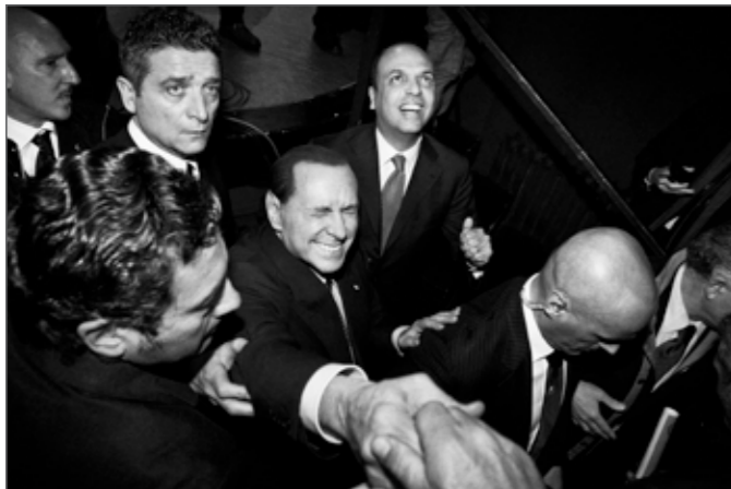
Italian elections