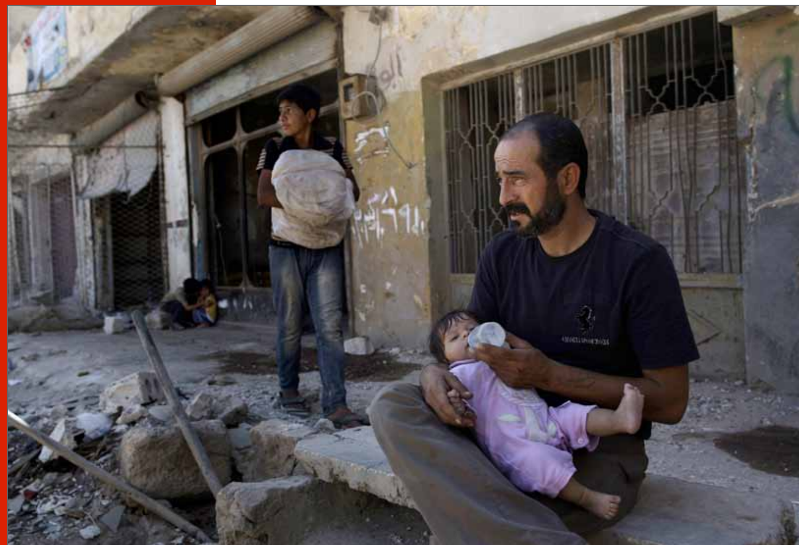
Père et fille devant leur maison en partie détruite, à Azaz, près d'Alep, Syrie, 28 août 2012.