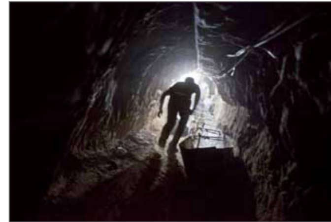
Gaza under the Israeli Blockade