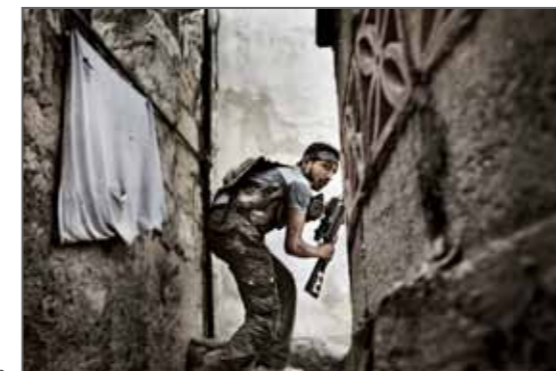
2 e Prix Spot d'information Reportages Alep, Syrie, 10 octobre 2012