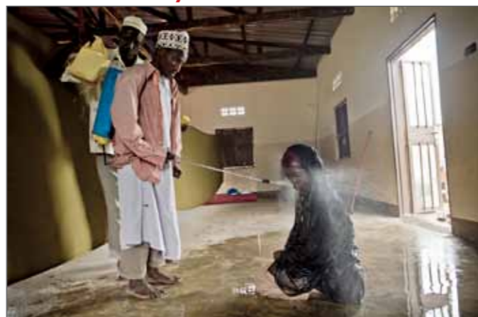
A mysterious disease in Uganda