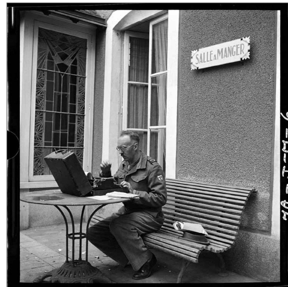
Un correspondant de guerre britannique au centre américain de presse, château de Vouilly, Calvados, juillet 1944.