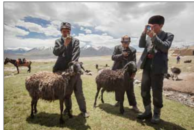
Wakhan Corridor