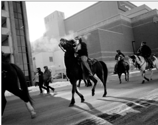
Forgotten Memories, Mankato, Minnesota, USA