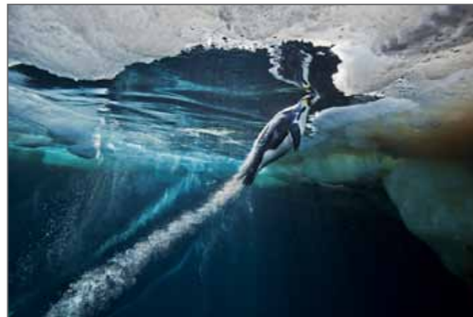
Emperor Penguins