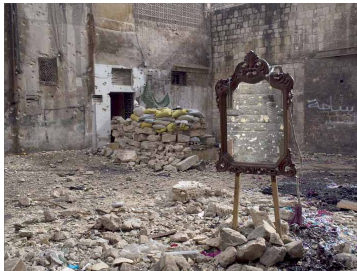
Ligne de front dans la vieille ville, 18 février 2013. Des combattants de l'Armée syrienne libre utilisent des miroirs pour repérer les snipers de l'armée régulière.