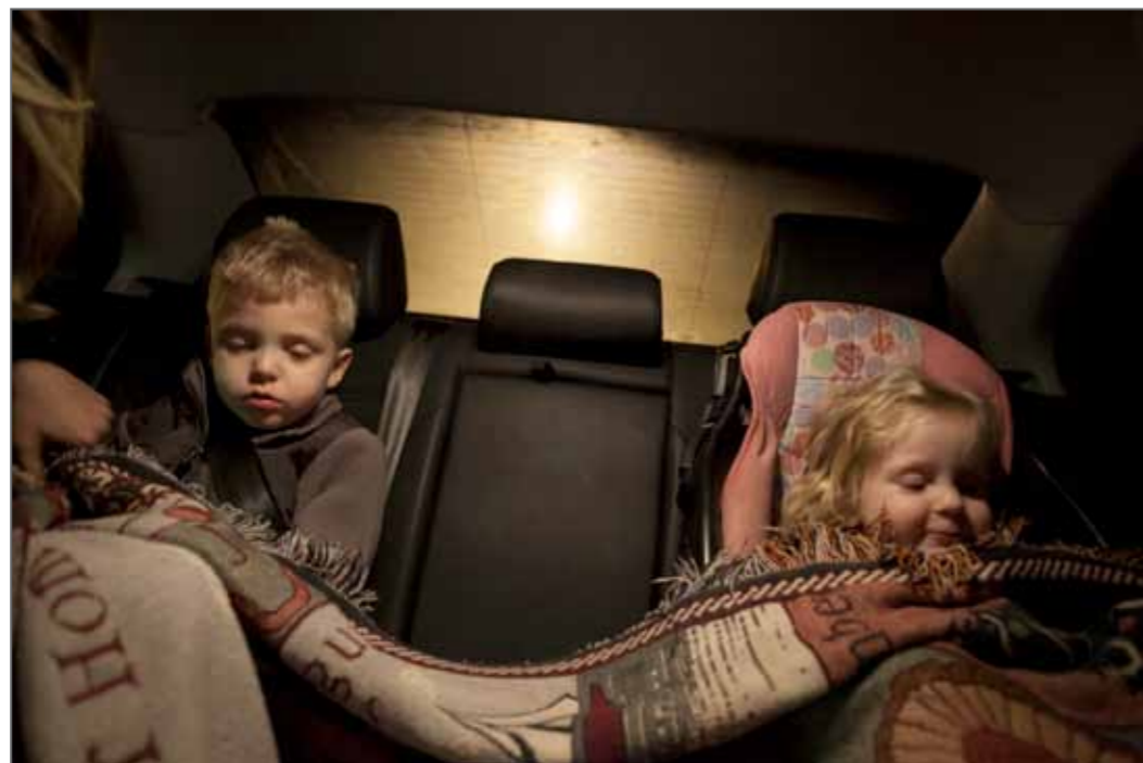
Après l'arrestation de Shane ce soir-là, Maggie installe Kayden et Memphis dans la voiture pour les emmener chez sa meilleure amie. Kayden, qui dormait pendant la dispute, ne comprend pas ce qui se passe et se met à pleurer à son réveil. Memphis, quant à elle, reste calme et s'occupe surtout de réconforter sa mère. Elle répète sans arrêt: « Ne pleure pas, maman, je t'aime. » © Sara Lewkowicz - Reportage by Getty Images - Lauréate du Prix de la ville de Perpignan Rémi Ochlik 2013

Sara Lewkowicz / Reportage by Getty Images