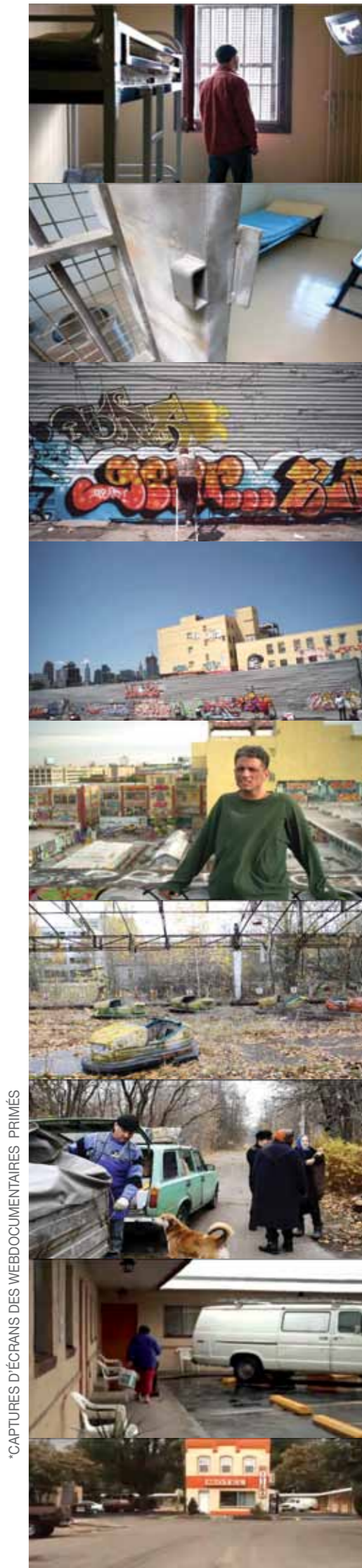
CAPTURES D'ÉCRANS DES WEBDOCUMENTAIRES PRIMÉS