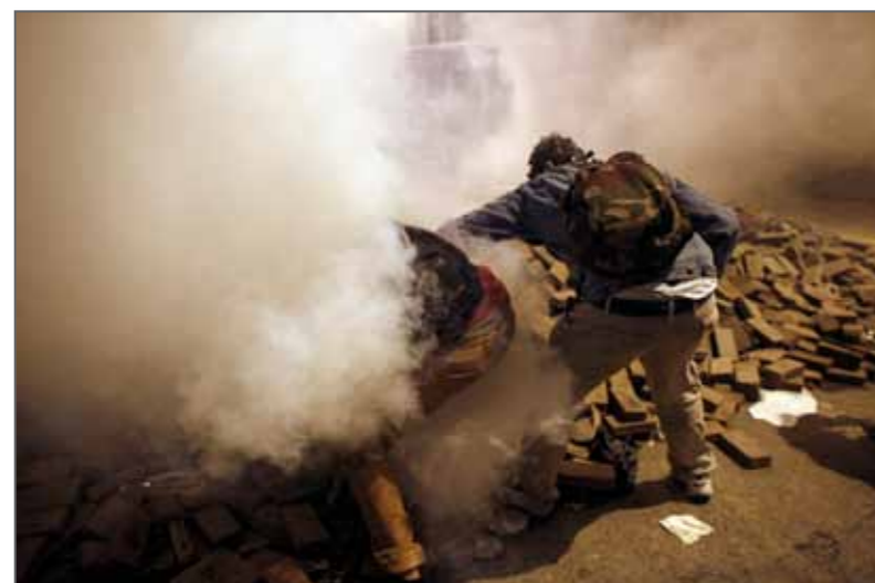
Des manifestants tentent de s'emparer d'une grenade lacrymogène pour s'en débarrasser, lors des accrochages avec la police anti-émeutes durant les manifestations contre le gouvernement du Premier ministre Recep Tayyip Erdogan.