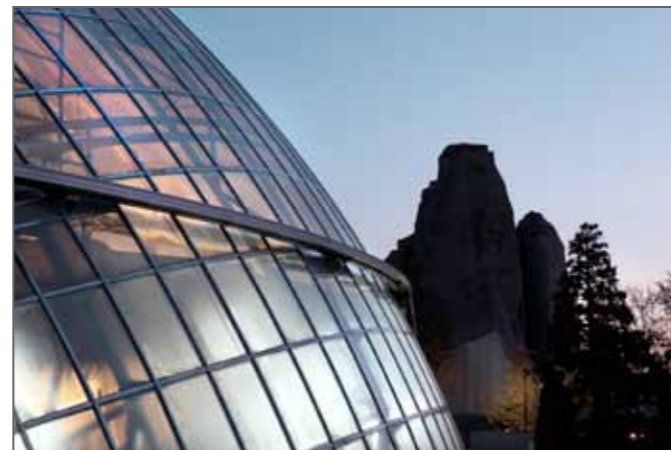
Parc Zoologique de Paris - Zoo de Vincennes © Manuel Cohen (Avec l'aimable autorisation du Muséum National d'Histoire naturelle).