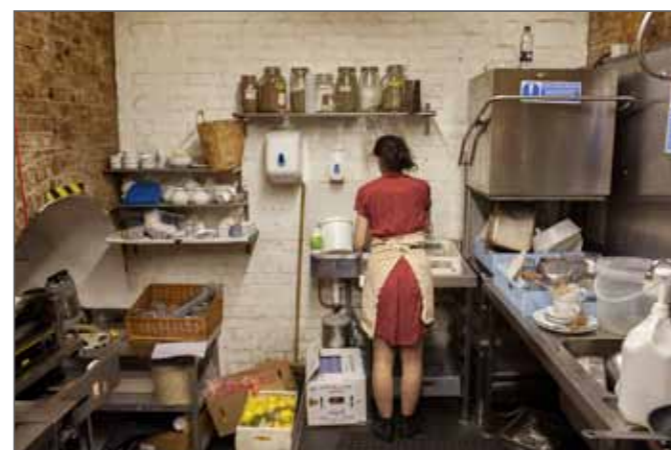
Anabela © Maciek Nabrdalik / VII - Prix Pierre & Alexandra Boulat 2012