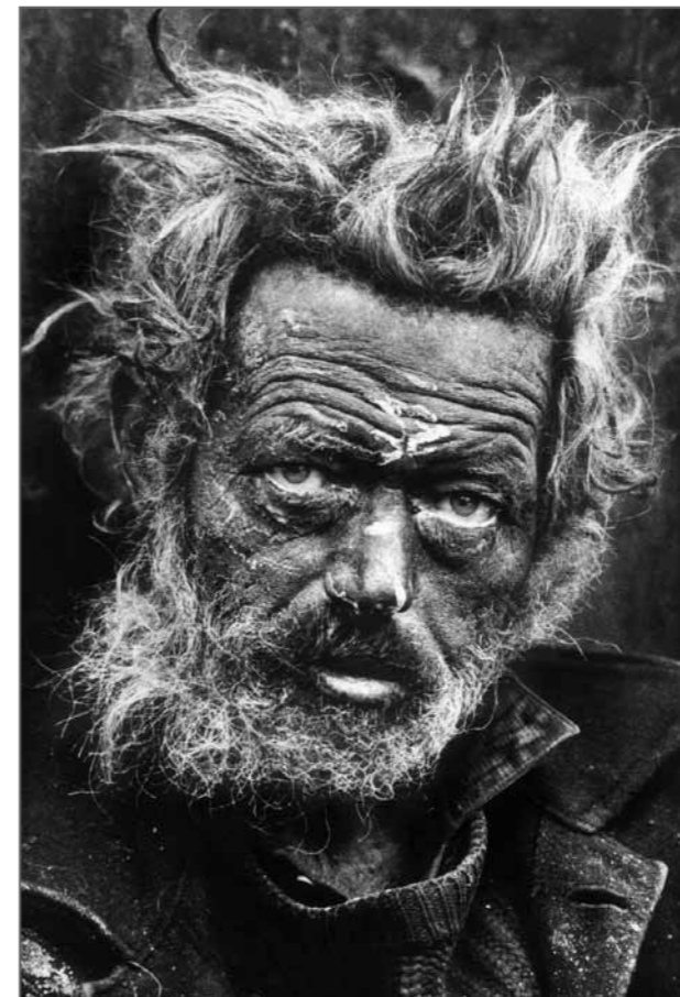
Sans-abri irlandais, East End, Londres, Grande-Bretagne, 1969.