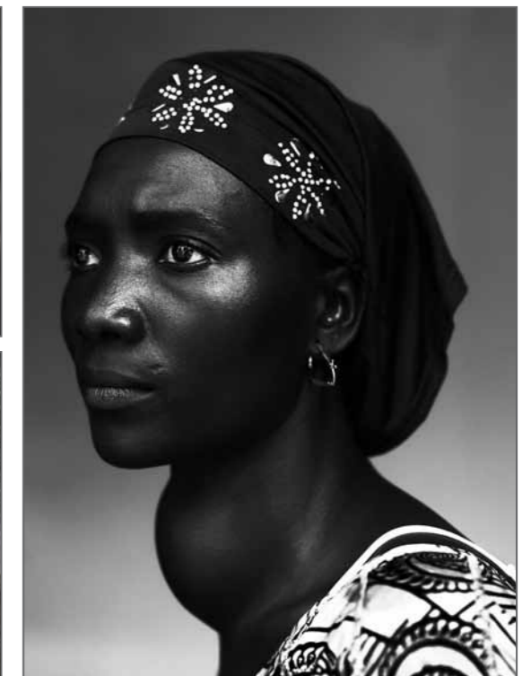
1 er Prix Portraits posés Reportages Conakry, République de Guinée, 17 octobre 2012