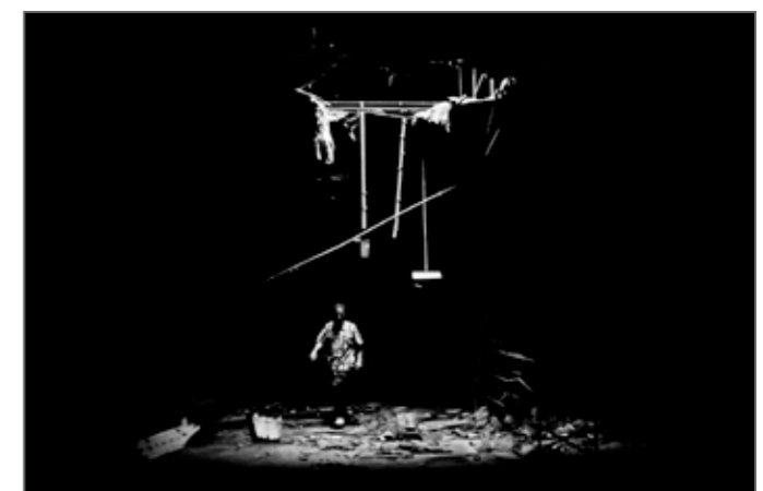
Xenios Zenus