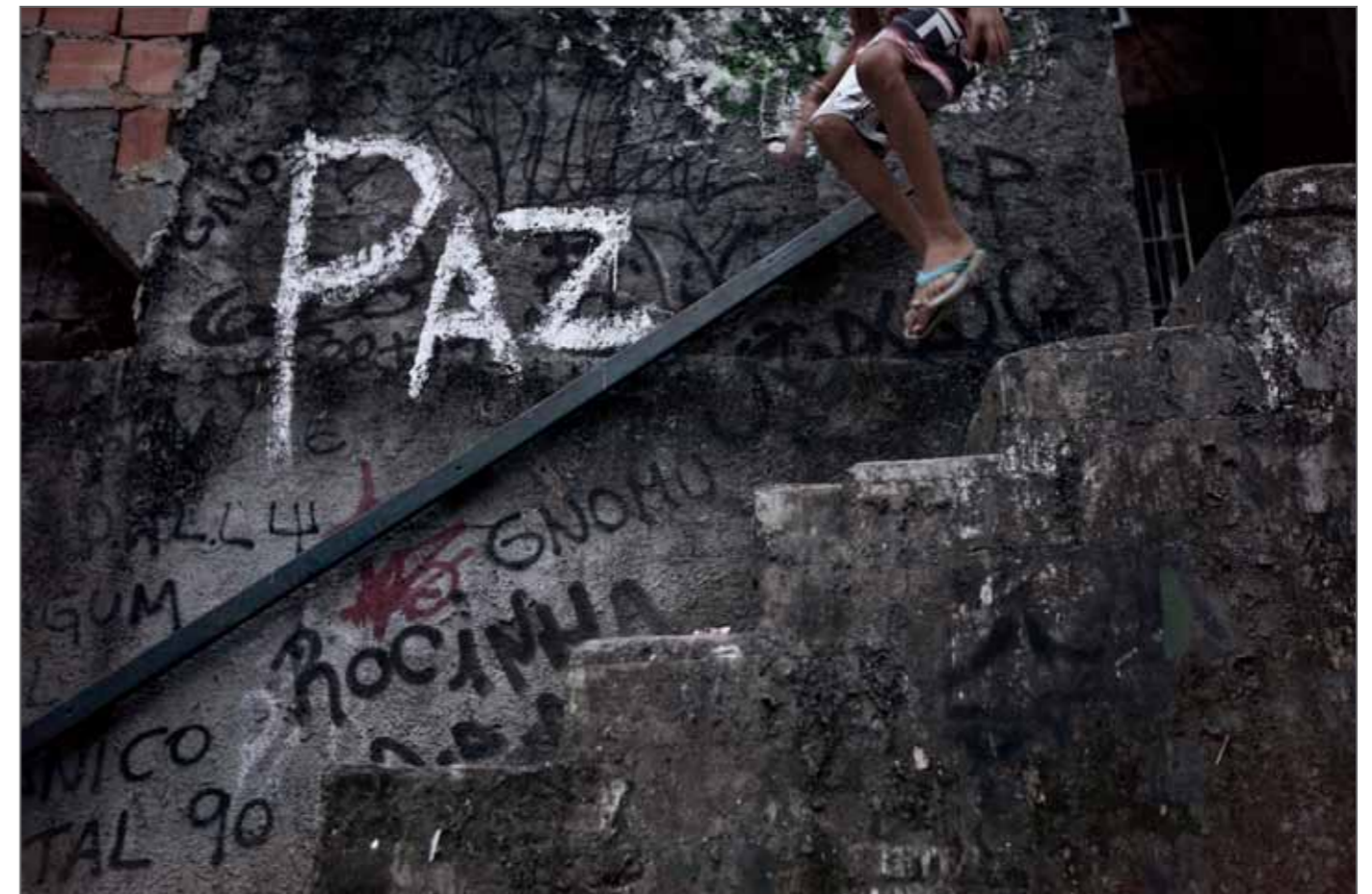
Jeune garçon devant un mur tagué du mot « Paix » à Rocinha, la plus grande favela de Rio, 22 février 2012.