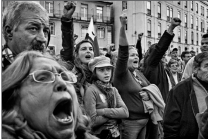
Portugal, Tension and Transition