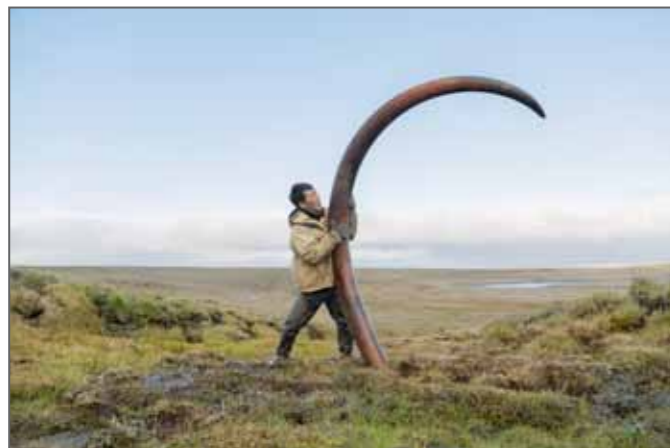
Mammoth Tusks