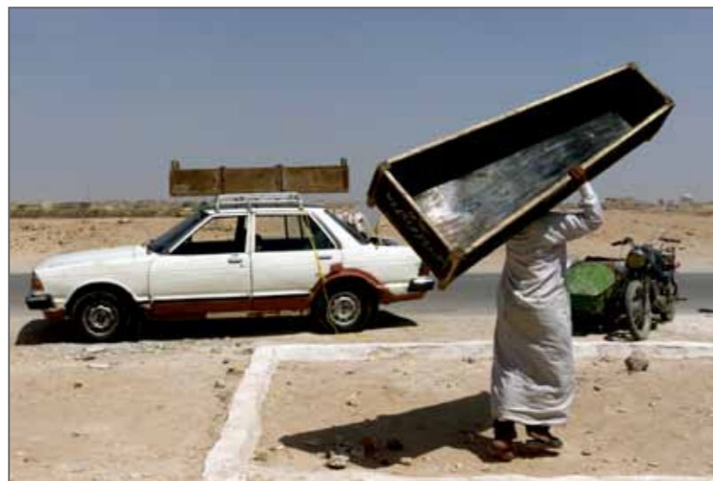
Irak, 30 août 2003. Un homme transporte un cercueil après les obsèques d'une mère et de sa fille, tuées toutes deux dans un attentat à la voiture piégée devant la mosquée de l'imam Ali à Najaf. Une explosion qui aura fait 80 morts et des centaines de blessés.

Je suis reconnaissant de pouvoir entrevoir l'étincelle malicieuse dans les yeux de mon fils, admirer ma fille magnifique qui affronte la vie comme une jeune adulte, et je suis heureux de sentir mon cœur battre la chamade lorsque j'aperçois ma femme qui passe une main dans ses cheveux.