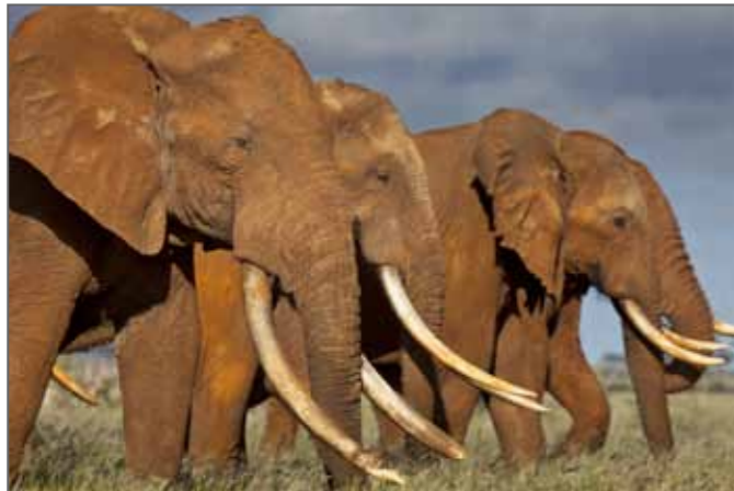
Ivory Worship