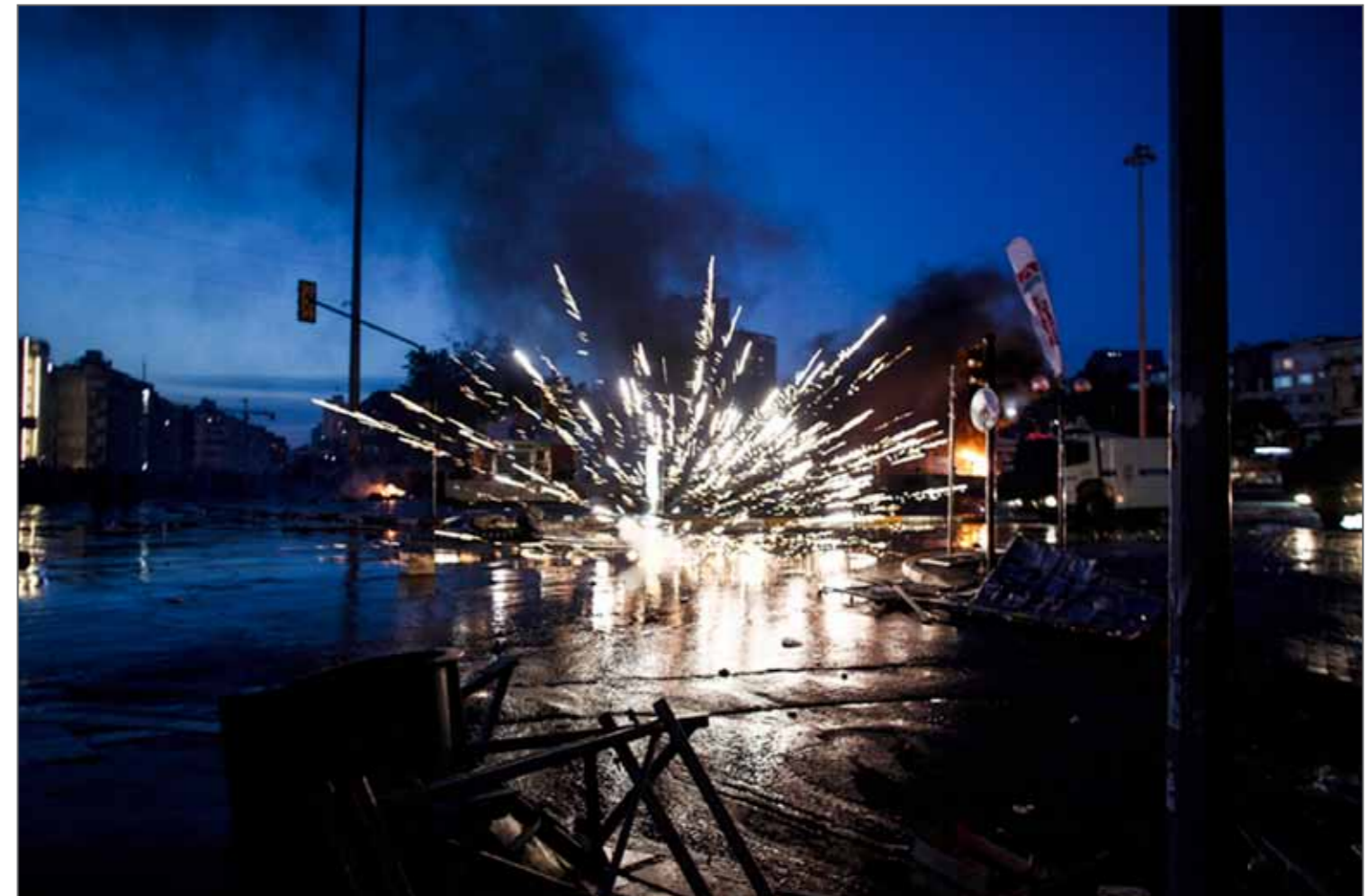
Explosion d'un feu d'artifice place Taksim à Istanbul, au moment des affrontements entre manifestants et police anti-émeutes, lors des grandes manifestations contre le gouvernement du Premier ministre Recep Tayyip Erdogan.