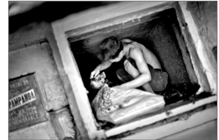
Living with the Dead: Manila's North Cemetery