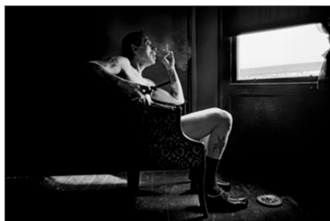
Uncle Charlie