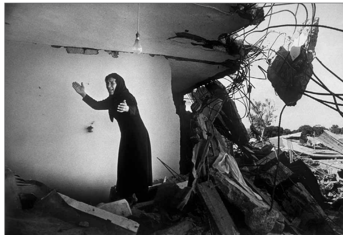
Le camp palestinien de Sabra après le massacre perpétré par les milices chrétiennes, Beyrouth, Liban, 1982.