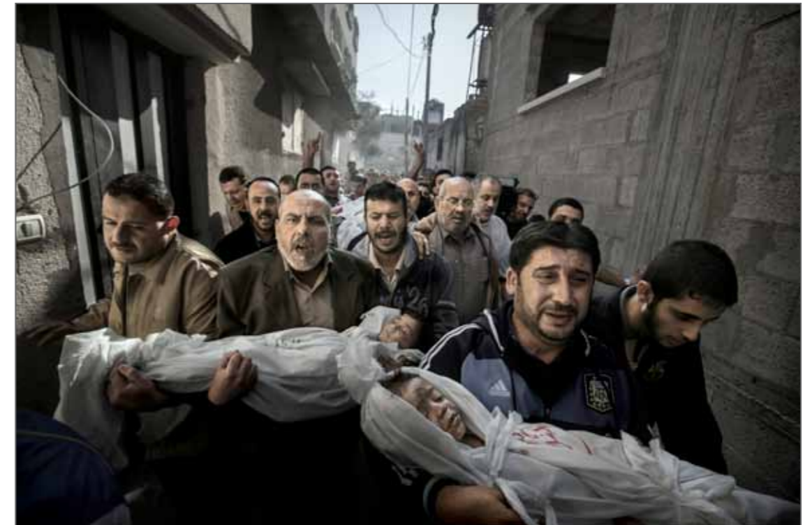
World Press Photo de l'Année 2012 Ville de Gaza, Territoires Palestiniens 20 novembre 2012

Canon Canon est depuis 1992 une entreprise partenaire de World Press Photo. Malgré l'évolution constante de la façon dont les journalistes racontent leurs histoires, le pouvoir de l'image reste aussi important et influent aujourd'hui qu'il l'était hier. La relation de longue date entre Canon et World Press Photo est nourrie par la passion de Canon de permettre à quiconque de raconter une histoire.