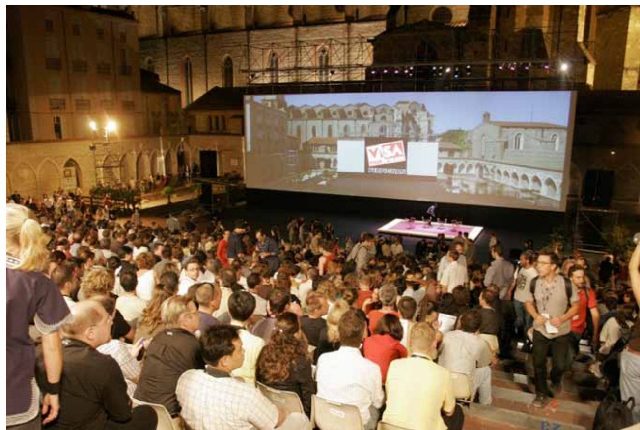
Le Campo Santo

PLACE DE LA RÉPUBLIQUE du jeudi 5 au samedi 7 septembre, à 21h45 Retransmissions en direct