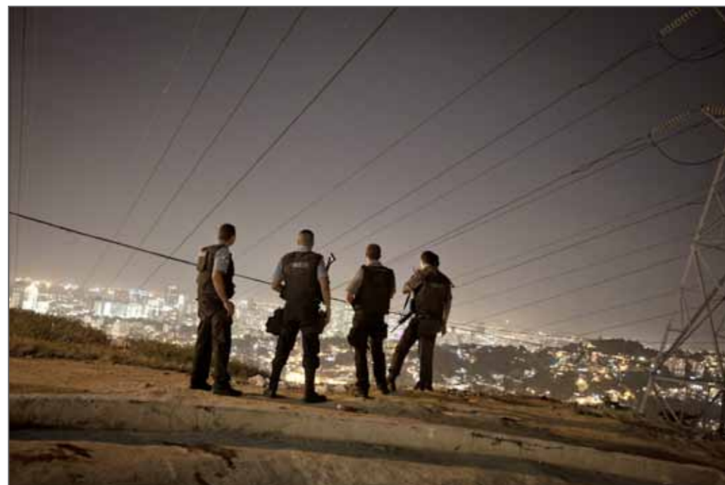
Des membres de l'Unité de police pacificatrice (UPP) sont postés sur un terrain vague surplombant le Complexe de Sao Carlos, 28 février 2012.