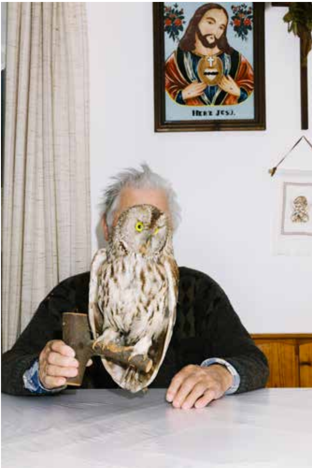
GRANDFATHER LOOKING GRANDMOTHER SAID IT'S OKAY 2018

Les portraits des finalistes sont dessinés par Michael-Birch Pierce