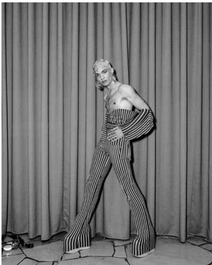
RITCHY PRINCESS OF THE HOUSE OF LADURÉE AT THE "ON THE COVER OF VOGUE" BALL UNDER DIRECTION BY ZUEIRA MIZRAHI. BERLIN OPULENCE, 2018

Les portraits des finalistes sont dessinés par Michael-Birch Pierce